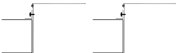
Montaż oprawy w suficie przystosowanym do chodzenia Fixture mounting in walkable ceiling

Oprawa do sufitów przystosowanych do chodzenia, produkujemy też oprawy w innych rozmiarach - wg. specyfikacji klienta Fixture for walkable ceilings, can be produced for other dimensions, according to customer specifications.