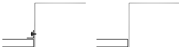
Montaż oprawy w suficie G/K Fixture mounting in plasterboard ceiling

Oprawa do sufitów G/K, produkujemy też oprawy w innych rozmiarach - wg. specyfikacji klienta Fixture for plasterboard ceilings, can be produced for other dimensions, according to customer specifications.